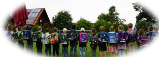
Rauswurfest mit Schulranzen-Modeschau